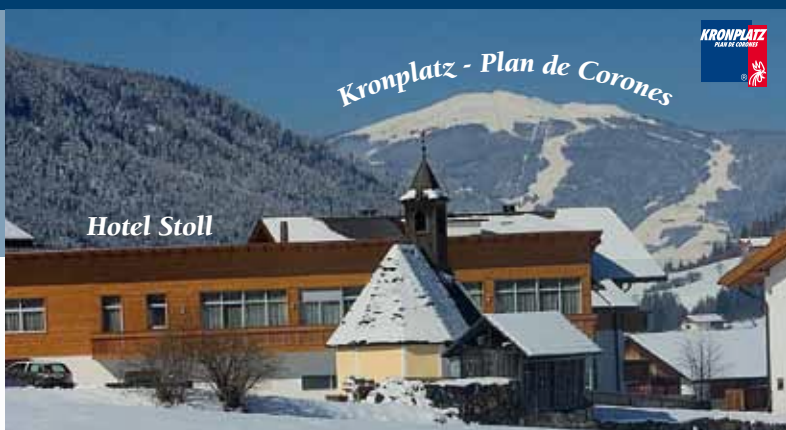
Kronplatz - Plan de Corones