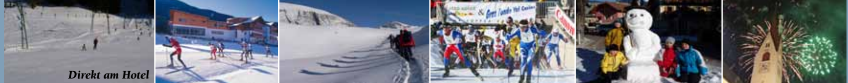
Direkt am Hotel