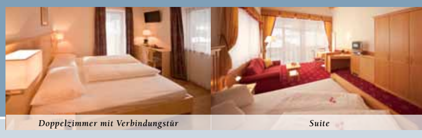
Doppelzimmer mit Verbindungstür Suite